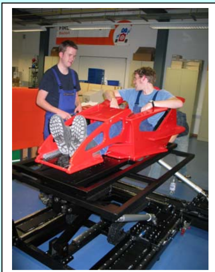
Die Sitzprobe ist gelungen!